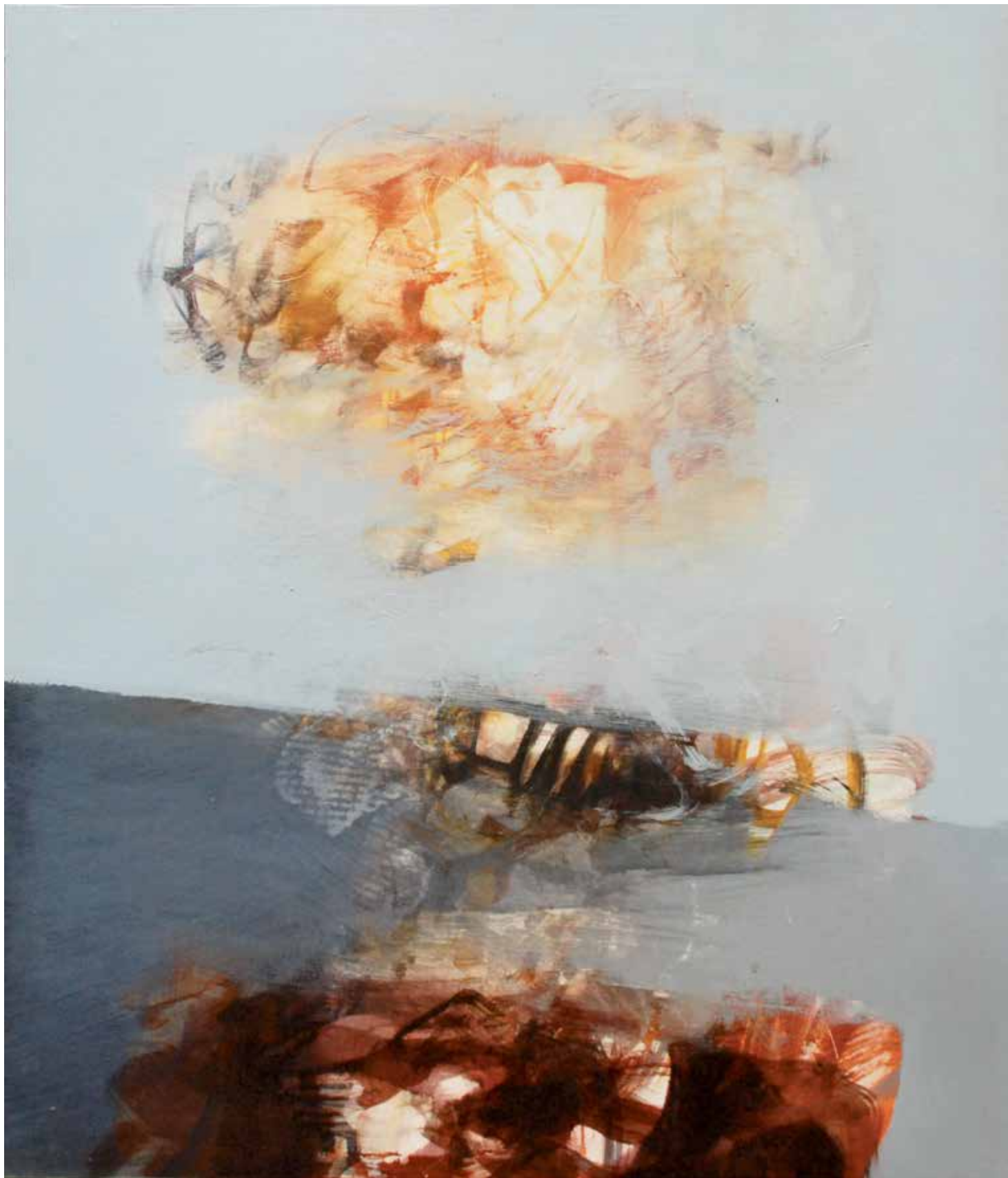
Sorvola, 2013. Acrilico su tela, 70x60 cm