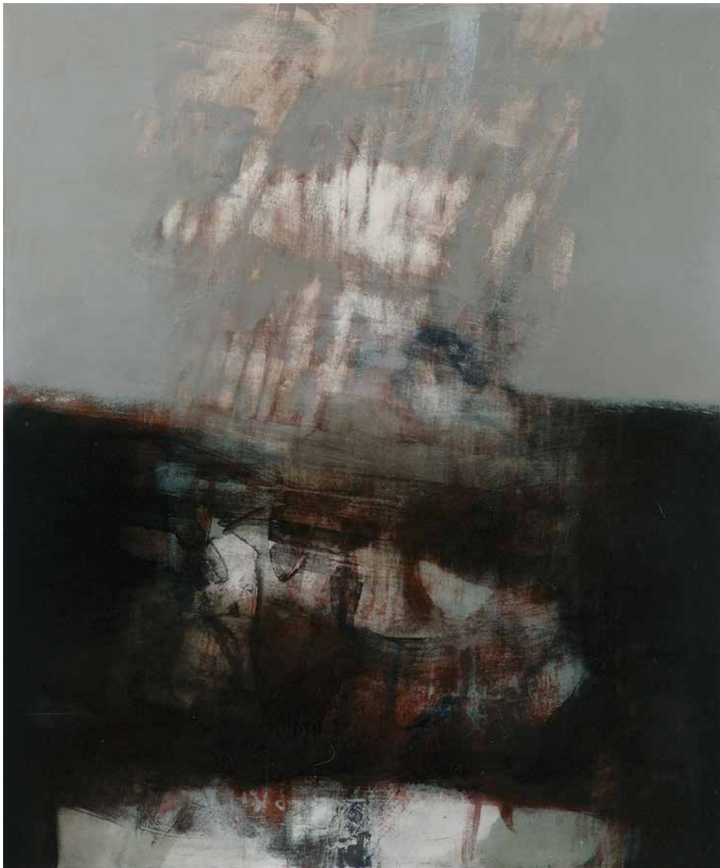
Sotto l'orizzonte , 2007. Tecnica mista su tela, 120x100 cm