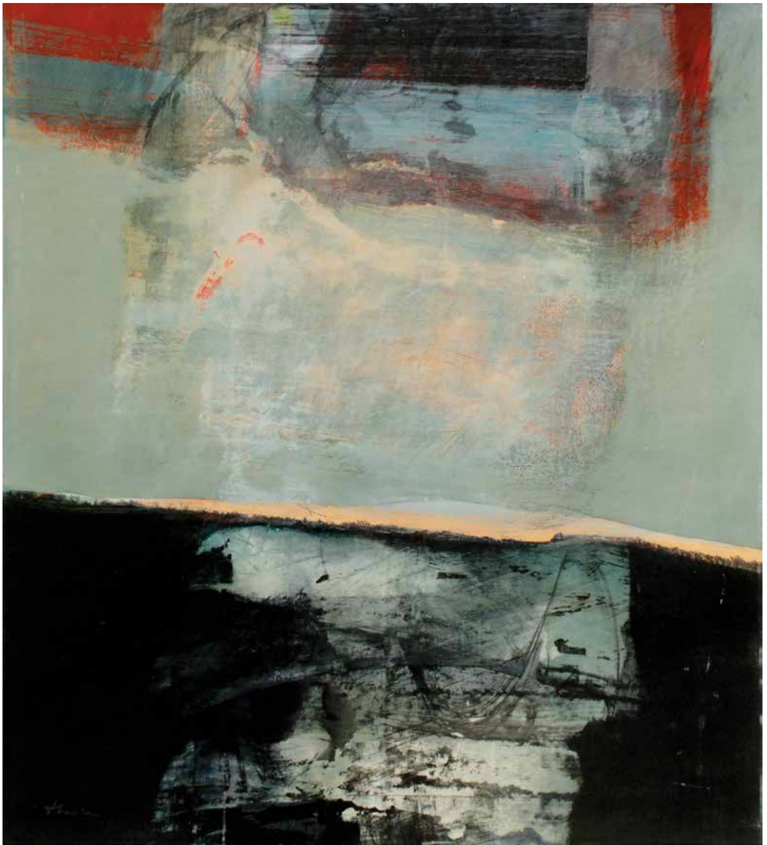
Sfiara, 2004. Acrilico su carta incollata su tavola, 90x90 cm