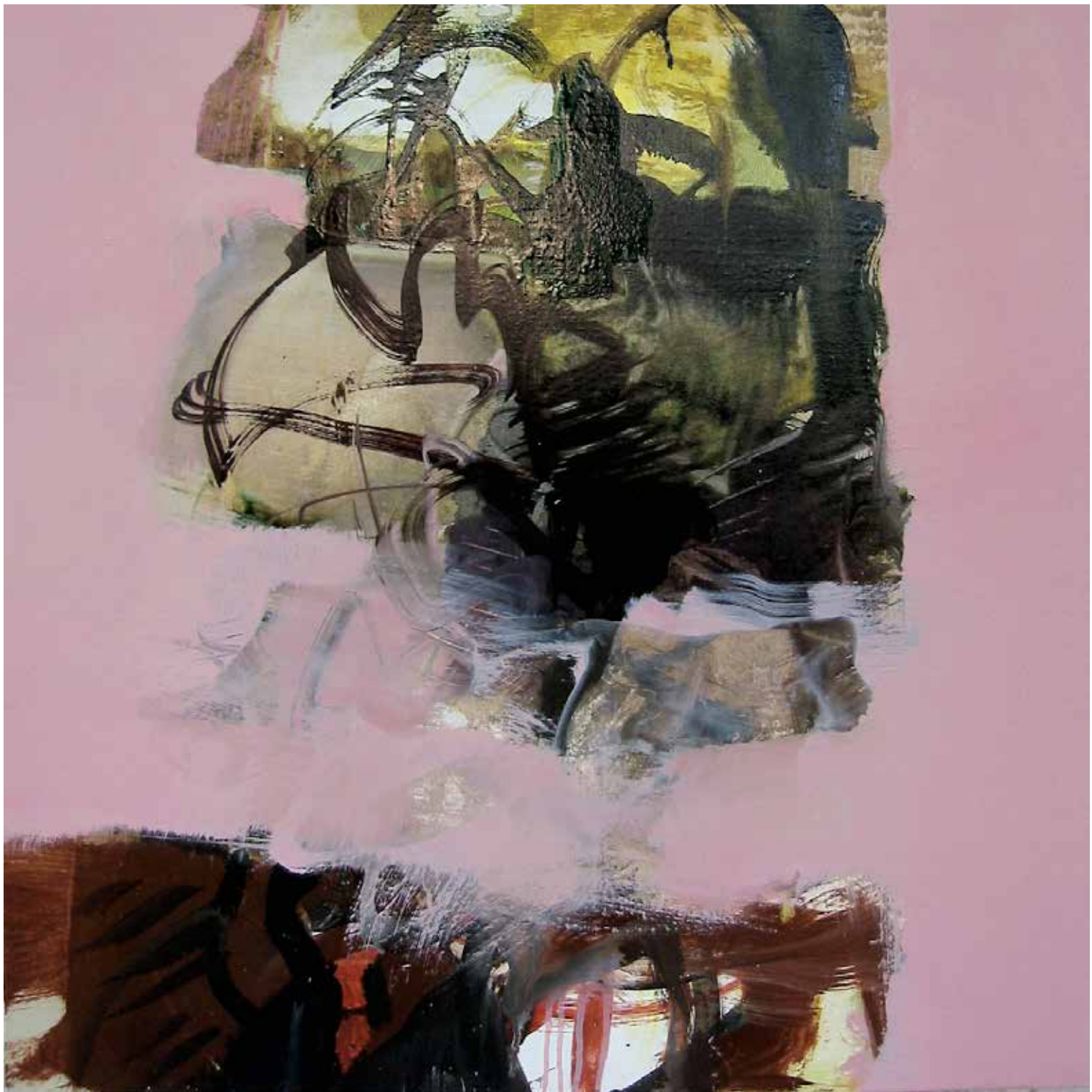
Sull'orizzonte sospeso, 2010. Olio su tela, 50x50 cm