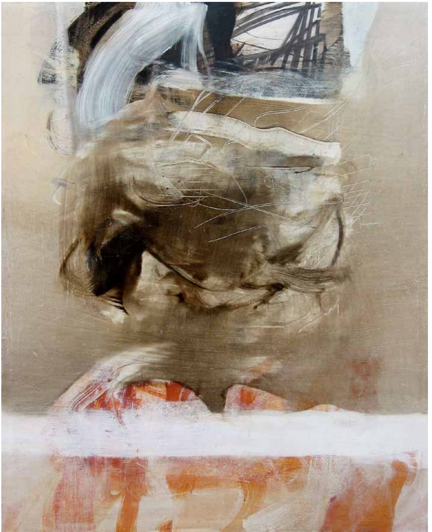
Affiora , 2005. Tecnica mista su tela, 100x80 cm