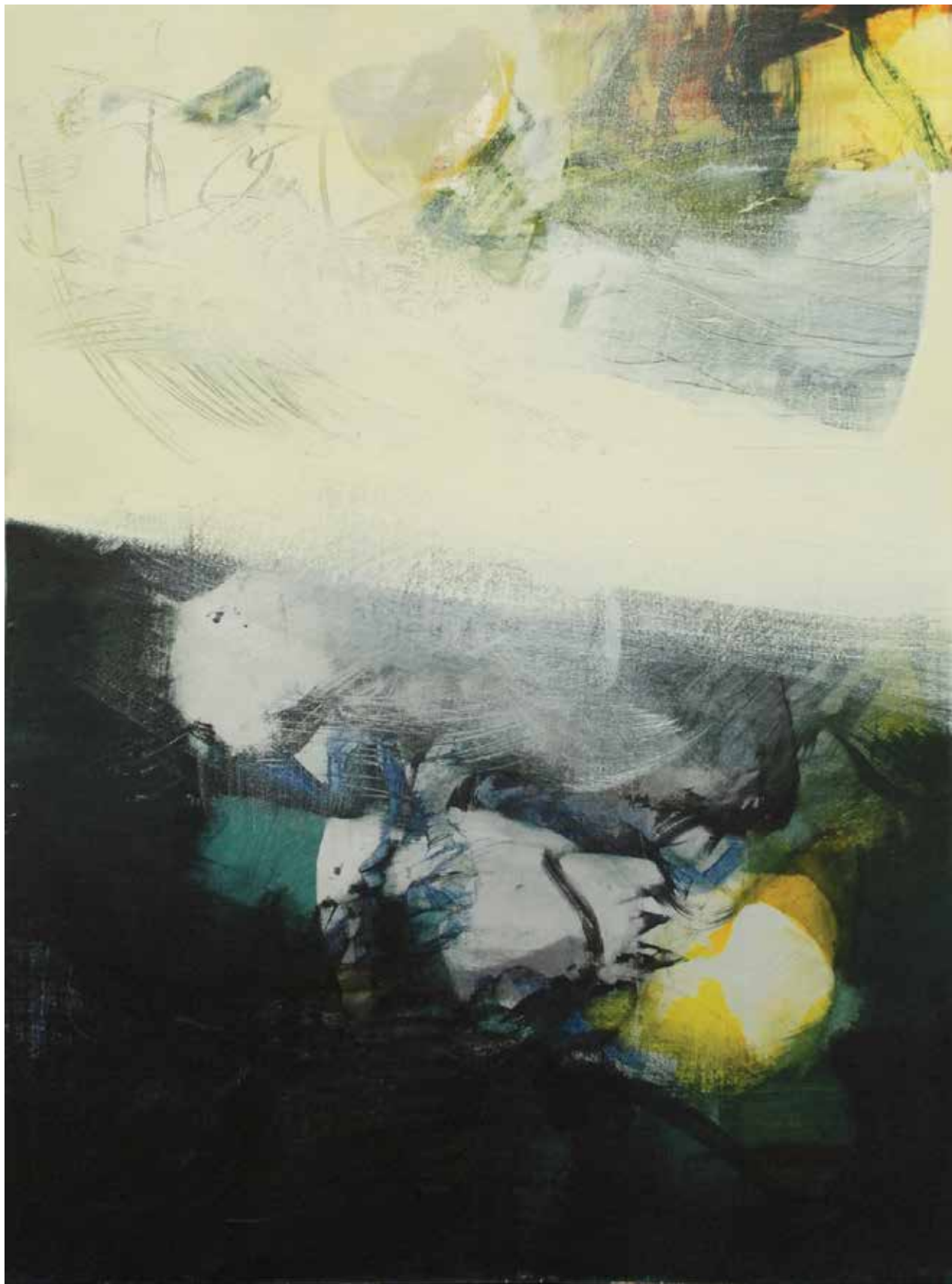
Colpo di vento , 2013. Acrilico su tela, 80x60 cm