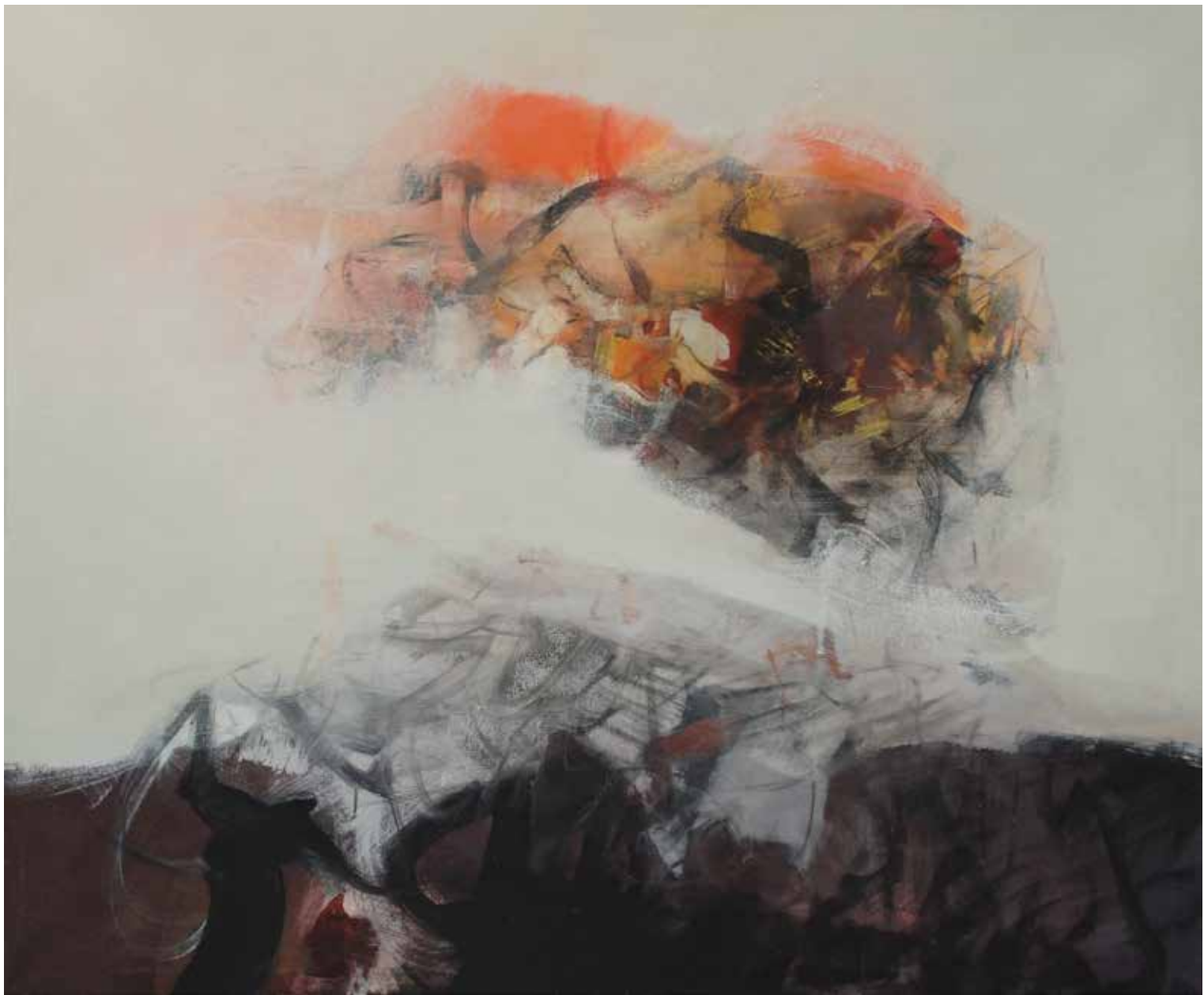
Sorvola minaccioso , 2016. Acrilico su tela, 120x100 cm copia