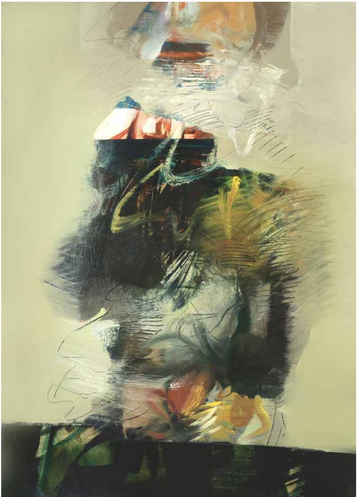
Figura sull'orizzonte , 2016. Tecnica mista su carta, 70x50 cm