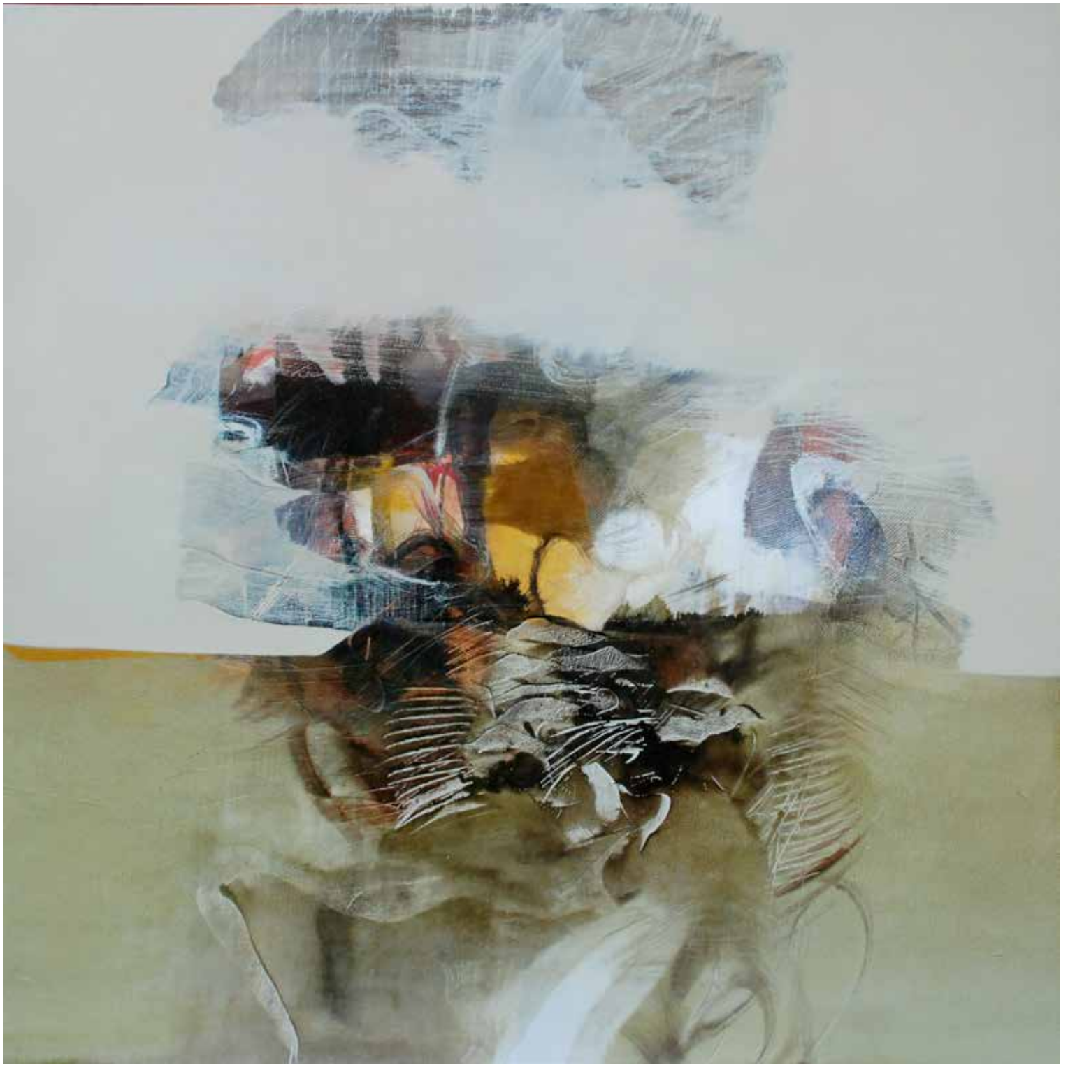
Affiora , 2012. Olio su tela, 100x100 cm