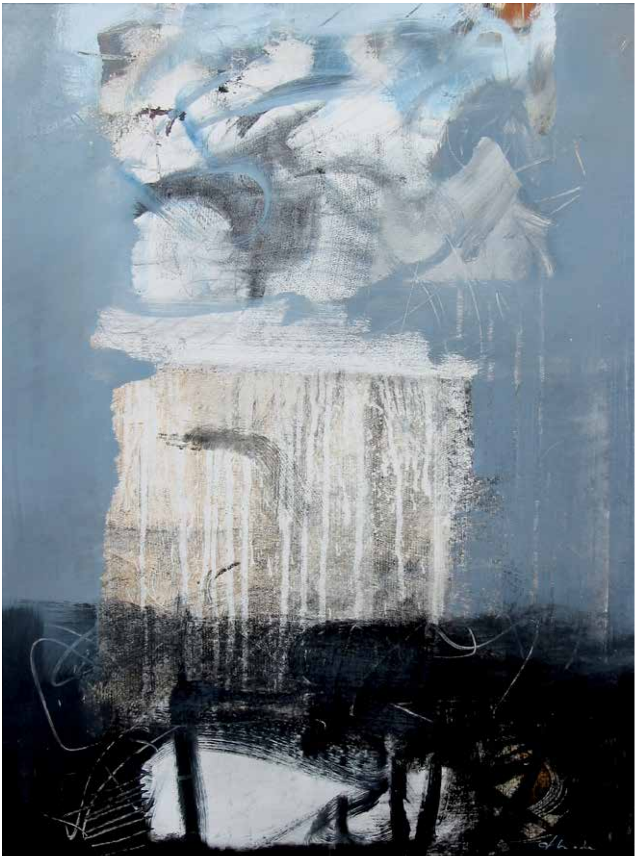
Imminente volo , 2006. Acrilico su tela, 80x60 cm